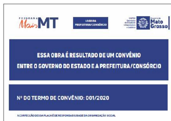
Modelo de Placas de Convênio – 2,50x1,25m

Essa placa deverá estar afixada em todas as obras realizadas no Estado de Mato Grosso.