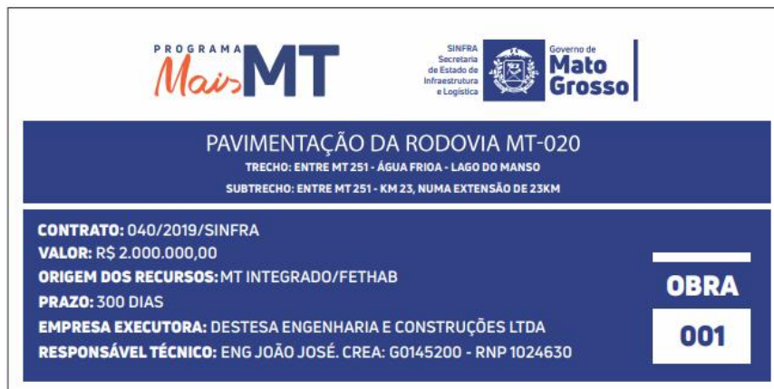
Modelo de Placa de Obra – 5,00x2,50m

Essa placa deverá estar afixada em todas as obras realizadas no Estado de Mato Grosso.